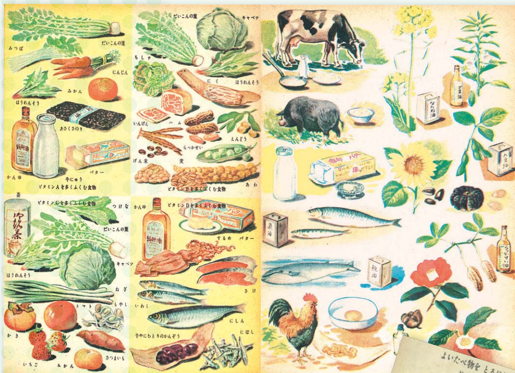
昭和24年「小学校5年生科学教科書」 文部省著作 文部省検査済 附属図書館所蔵